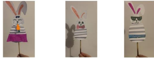
School No. 4 Sibiu, Romania